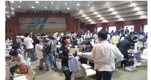
↑↑ 昨年の様子 ↑↑

会場受付に記入用紙を用紙していますので、そこで記入してください。クラブ等で来場できなくても家族の参加であればOK。記入するのを忘れた場合は上記ポイントの進呈は行いませんので注意してください。